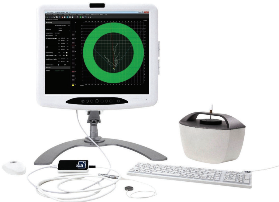
Abb. 1: Komponenten des DIR® Systems.

FACHBEITRAG. DAS DIR® SYSTEM – EINE STANDORTBESTIMMUNG (TEIL 1) /// Das DIR® (Dynamic Intraoral Registration) System ist ein Gerät zur Lokalisation der physiologischen bzw. zentrischen Kondylenposition des Unterkiefers und dient damit als Voraussetzung für weitere temporäre sowie definitive therapeutische Maßnahmen. In zwei Beiträgen werden das CMD-Krankheitsbild (Teil 1) und die schrittweise Anwendung des DIR® Systems (Teil 2), einschließlich vorausgehender Diagnostik, erläutert.